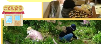
おいでん家/庭の清掃草取り

❖諏訪神社さんから秋祭りのために準備していた卵を、子ども食堂へいただきました。栄養価が高く利用しやすい食材で喜ばれました。