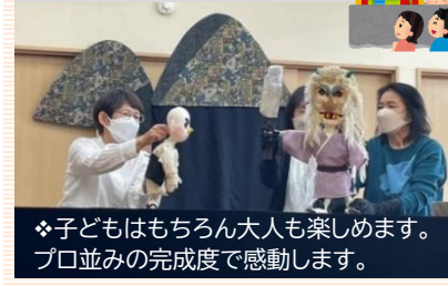
=人形劇かざぐるま=