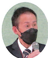
社会福祉協議会 事務局長