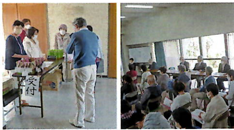
受付 福祉委員会役員