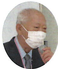
開会宣言 民生児童委員会会長