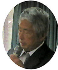
監査報告 総代会副会長