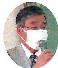
老人クラブ連合会 会長