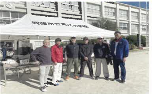
▲連尺学区社教委員会グランドゴルフ大会 12/1