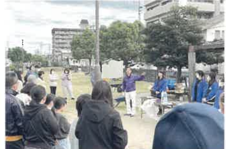
▲早川緑道清掃 末広町 11/10