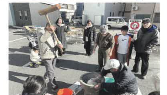
▲連尺通餅つき大会 12/22