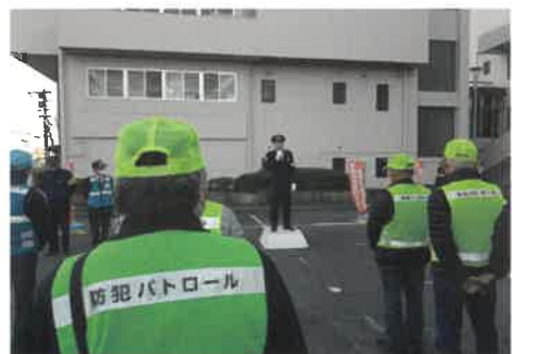
▲青パト防犯パトロール 12/17