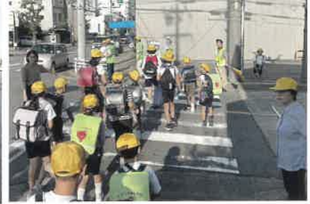
▲交通指導 材木町 9/24