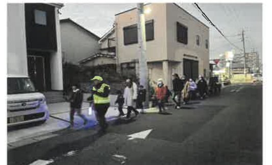
▲末広町年末防犯防災パトロール 12/23