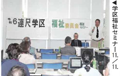
▲学区福祉セミナー 11/11