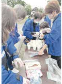
▲自主防災訓練 末広町 ▲老壮クラブバスツアー 11/27