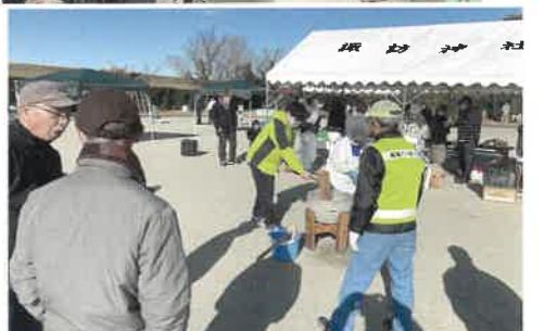
▲八帖北町餅つき大会 12/22