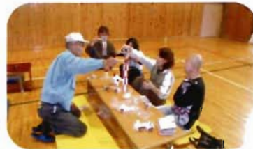
真剣に製作中です