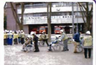
活動模擬体験の様子