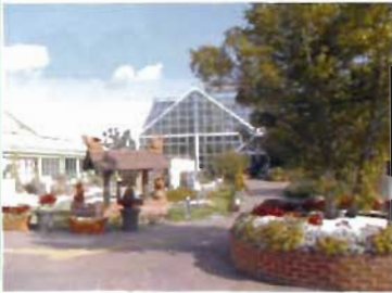
あおいパーク全景