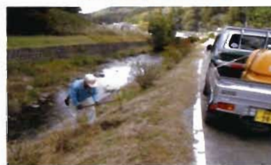
自然環境保全活動とアジサイ植樹風景