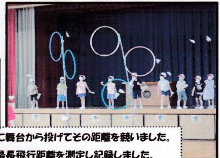
1, 2年生がクラス毎に舞台から投げてその距離を競いました。 メジャーで各クラスの最長飛行距離を測定し記録しました。

紙飛行機作り 約 85名×2回 最長飛行距離=2年生が16m10cm、1年生は11m10cmでした。