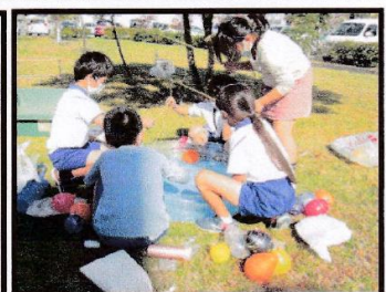
風船ヨーヨー作り 10テーブルで風船ヨーヨーを全員が5個つくりました。その後は中庭芝生のうえで 自分でつくった風船を釣って楽しみました。指導者20名 前半4年生40人、後半3年生33人