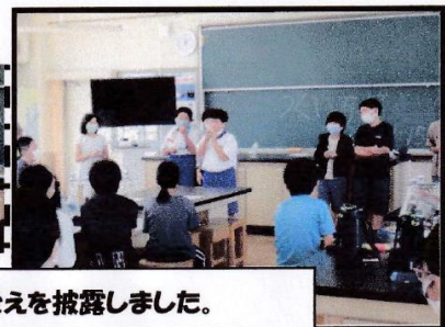
うぐいす笛作り 第1理科室 全員が出来栄を披露しました。