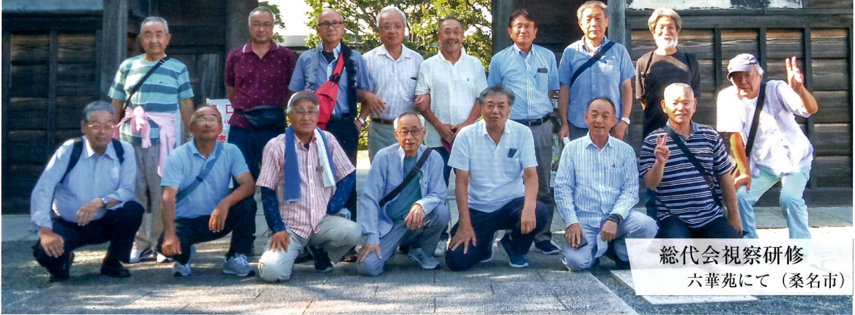
総代会視察研修 六華苑にて（桑名市）