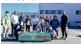
⑧道路ボランティア清掃 2

A 総代会長 令和5年度上地区総代会・上地まちづくり協議会要望書の回答が届きました。(全文をお知りになりたい方は、各町総代までお問い合わせ下さい。)