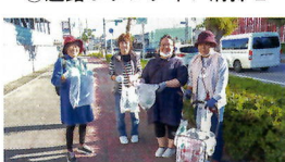
⑨道路ボランティア清掃 3