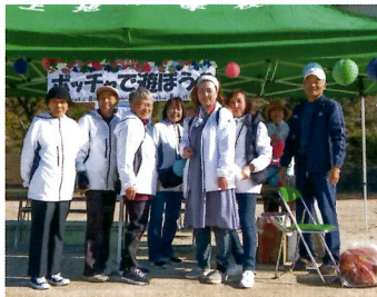
⑮エンジョイ!ポッチャ (民生委員)