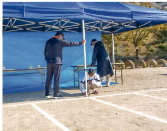
⑭めざせ 大当たり!! (フット少年団)