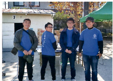
⑰おやじのダーツに挑戦 (おやじの会)