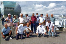
①アクアプラザながら

る学区として治水を考えるきっかけにしたい。また川越電力館テラ46(写真②)で、電力の大切さを痛感した。節約を考えていきたい。日頃の生活の意識づけを考えることができた視察研修でよかった。