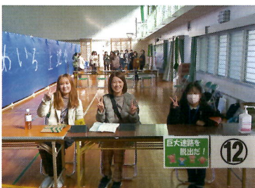
⑳巨大迷路を脱出だ! (PTA2)