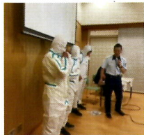
⑩防災講演会感染防護服

地震に備えた準備から、発生したらどうするか、その後の行動は、わかりやすく説明があったよかったですと思う。レッドサラマンダーの紹介ビデオは心強かつたし、感染防護服の試着も経験できたしよかったですね。9月3日の学区防災訓練に生かされたと思います。(写真⑩)