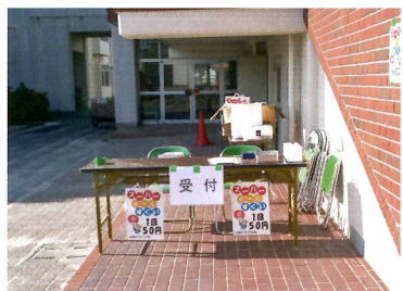
㉒スーパーボールすくい (子ども会)