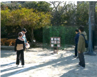
⑯パーフェクト目指せ!!ストラックアウト (ソフト少年団)