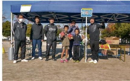
⑫PKチャレンジ (サッカー少年団)