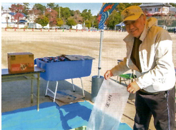
⑲金魚すくい (総代会)