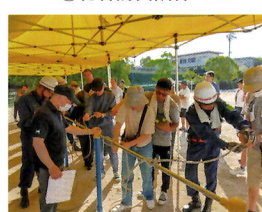
⑥総合防災訓練救助救出

A 総代会長 10月22日(日) 午前7時30分道路ボランティア清掃・町内一斉清掃は、今年も多くの方が参加していただき、町内がきれいになりました。