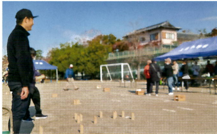
⑬モルックに挑戦 (体育部)