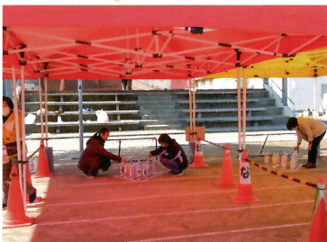
⑱ボトルDEストライク (女性部)