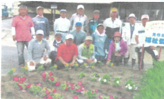
ふれあい活動部の皆さん (5月14日)